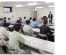
環境関連法令研修

「ものづくり」と環境問題は密接に関わり、環境法令を中心とした環境教育は「ものづくり」に欠かすことができません。このような視点から2014年度も各所社で研修会を開催。多くの従業員が自己研鑽に取り組みました。